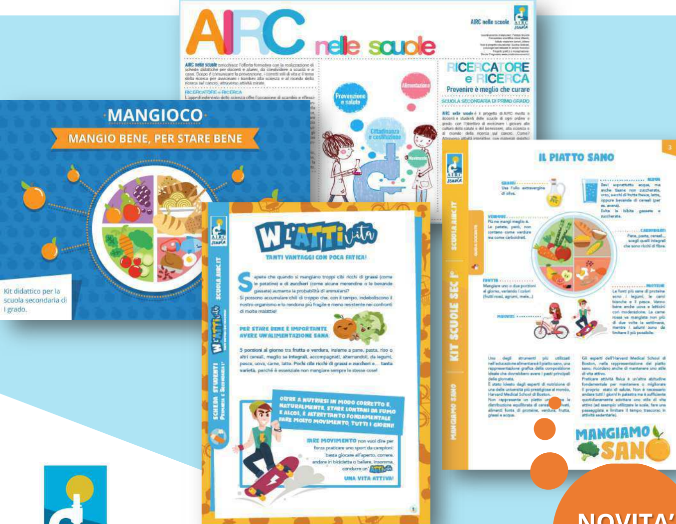
Kit didattico per la scuola secondaria di I grado.